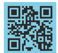
Scheda prodotto Product data sheet